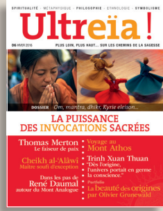
06 HIVER 2016 - 19.90€