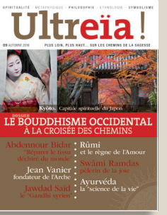
09 AUTOMNE 2016 - 19.90€