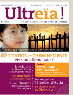
04 ÉTÉ 2015 - 19.90€