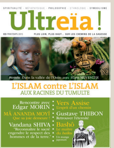
03 PRINTEMPS 2015 - 19.90€