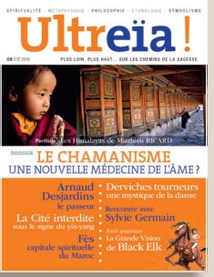
08 ÉTÉ 2016 - 19.90€