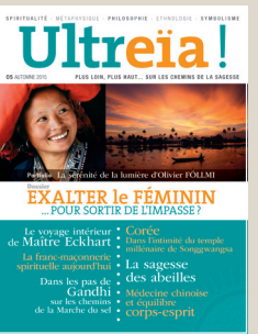
05 AUTOMNE 2015 - 19.90€