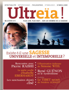
01 AUTOMNE 2014 - 19.90€