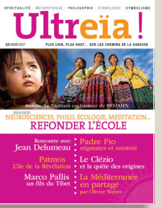
10 HIVER 2017 - 19.90€

Découvrir tous les sommaires des anciens numéros sur www.revue-ultreia.com