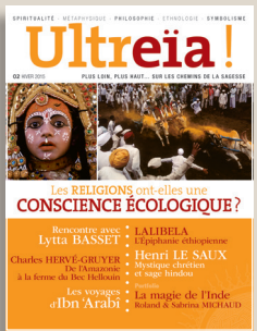
02 HIVER 2015 - 19.90€