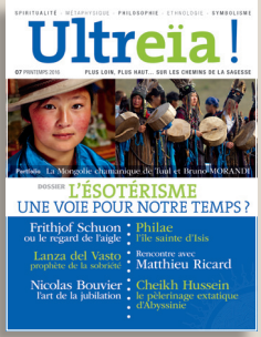
07 PRINTEMPS 2016 - 19.90€