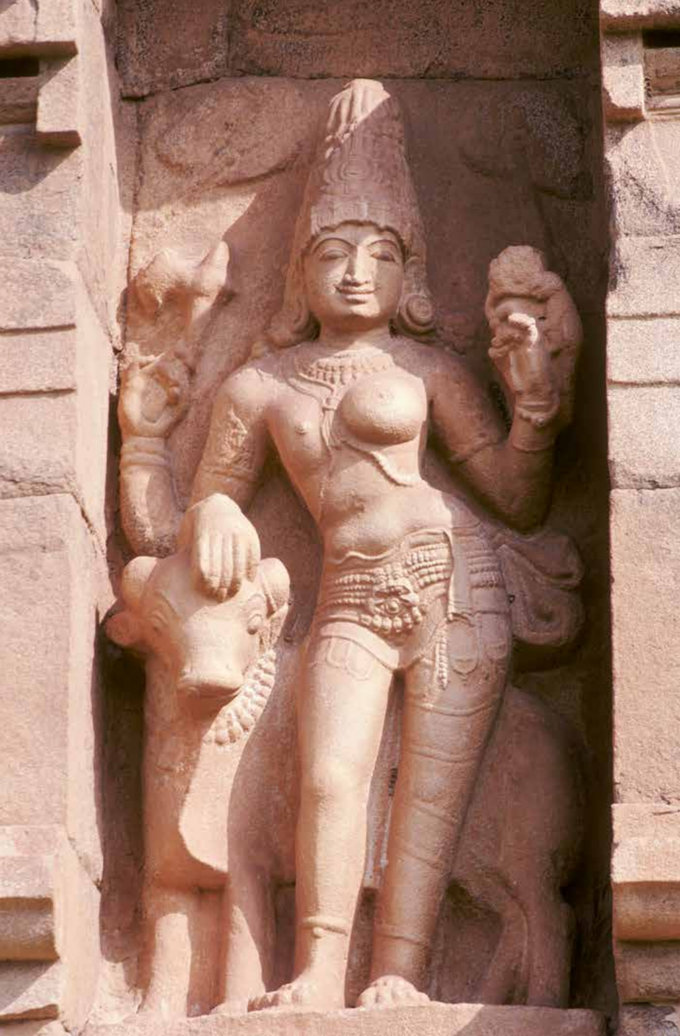
Ardhanarishvara, représentation androgyne de Shiva et de sa Shakti.