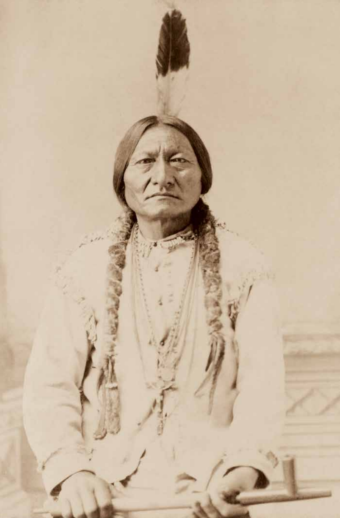
Sitting Bull (1831-1890), chef de guerre et holy man.