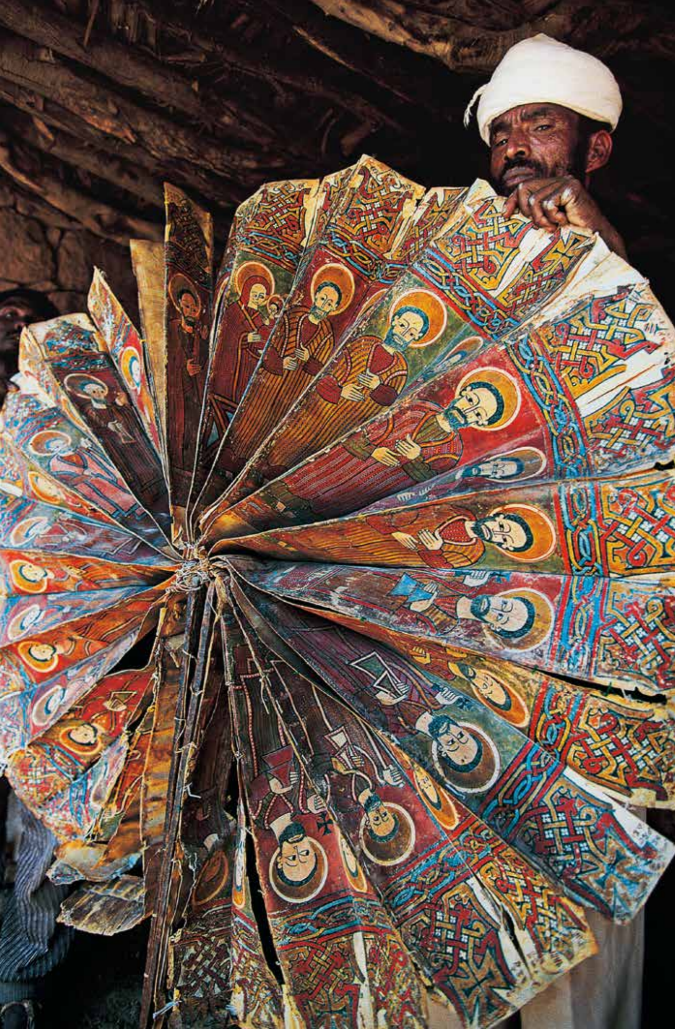
Éventail médiéval de Lalibela (Éthiopie) représentant Marie, les Apôtres et des saints.